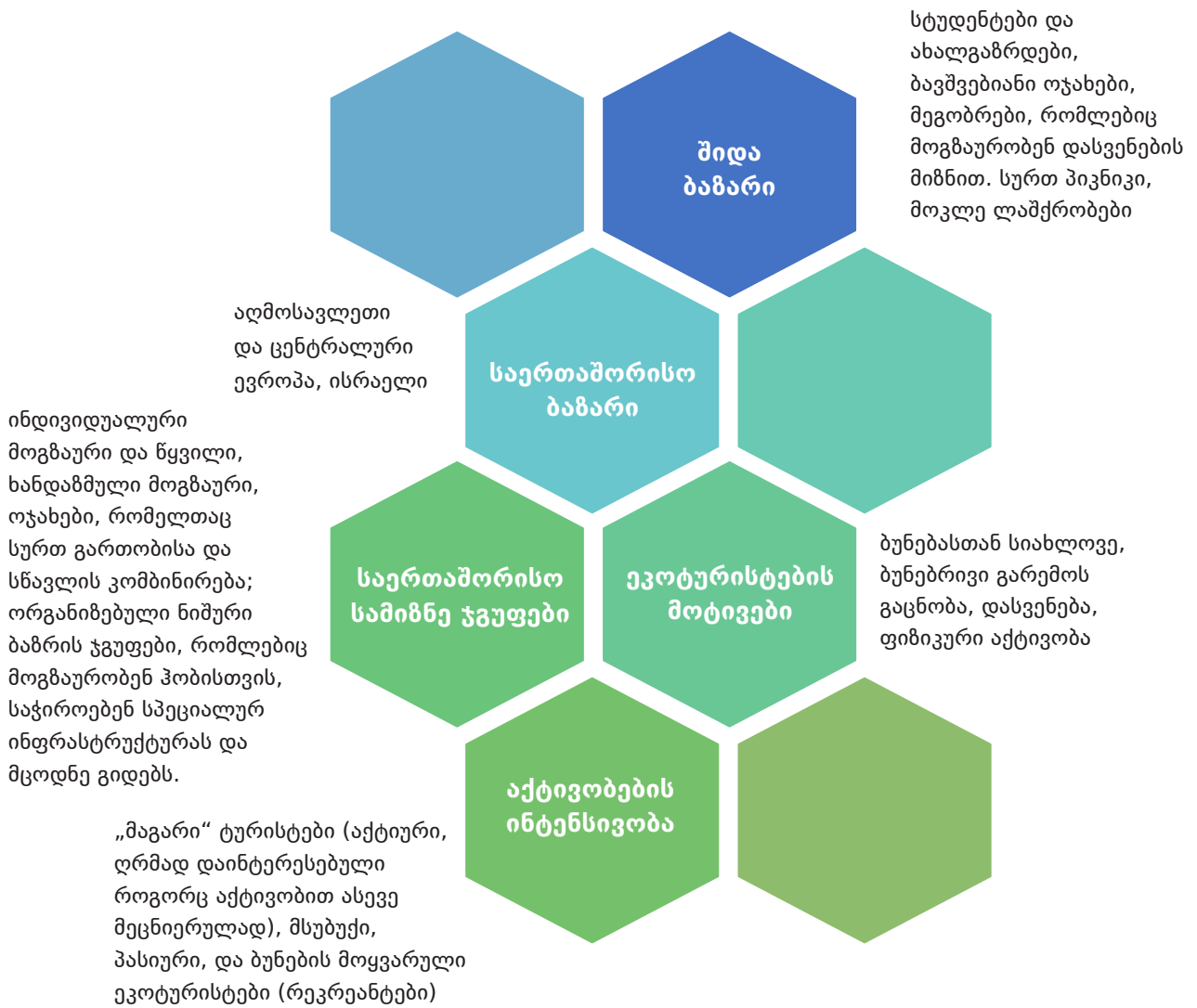
სქემა 2. ეკოტურისტების სხვადასხვა სეგმენტი საქართველოში